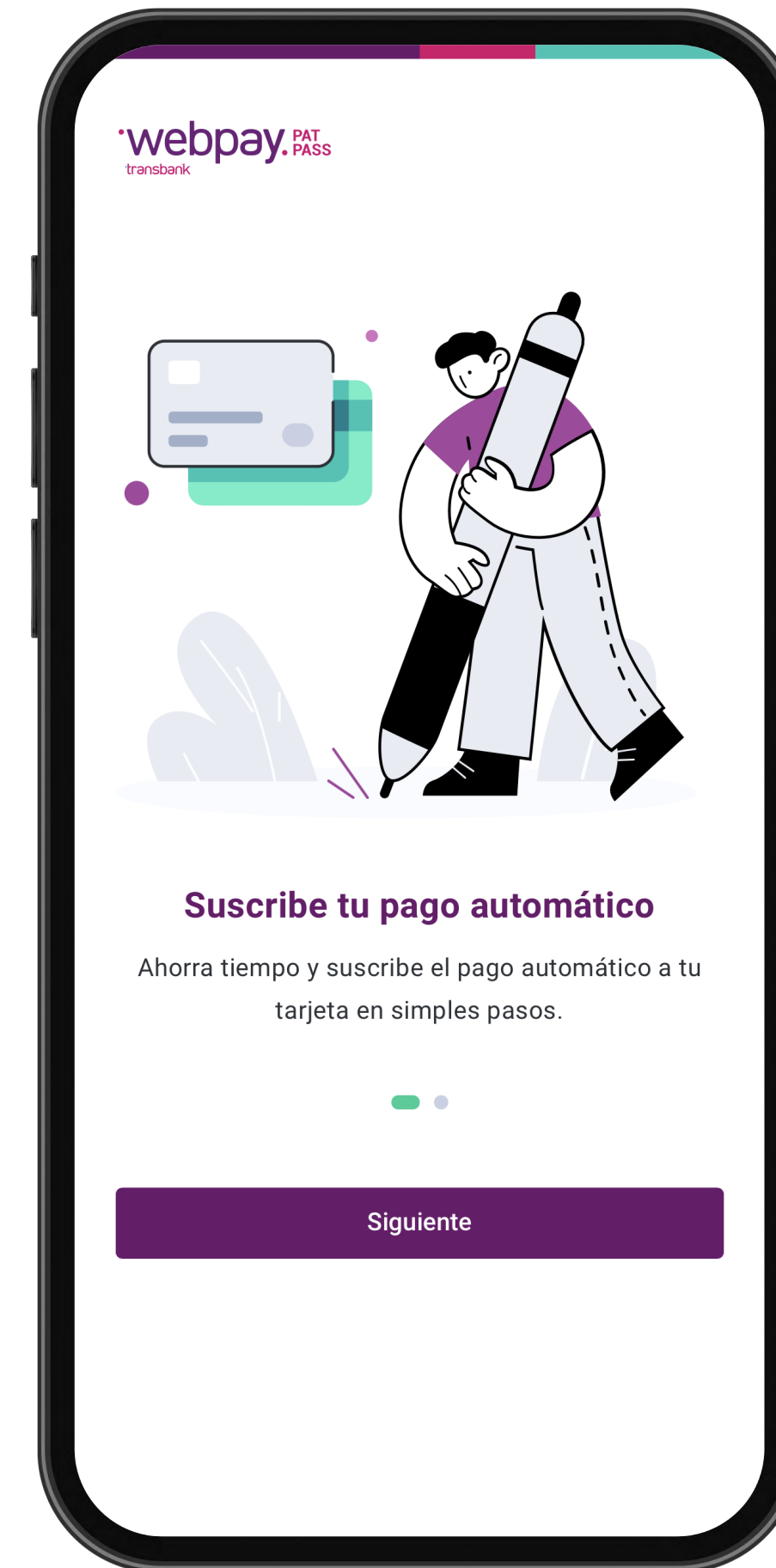
Nuevo mandato digital